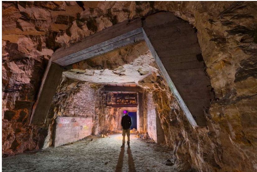
↑ Passage consolidé