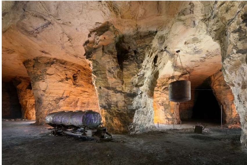
↑ Les deux citernes