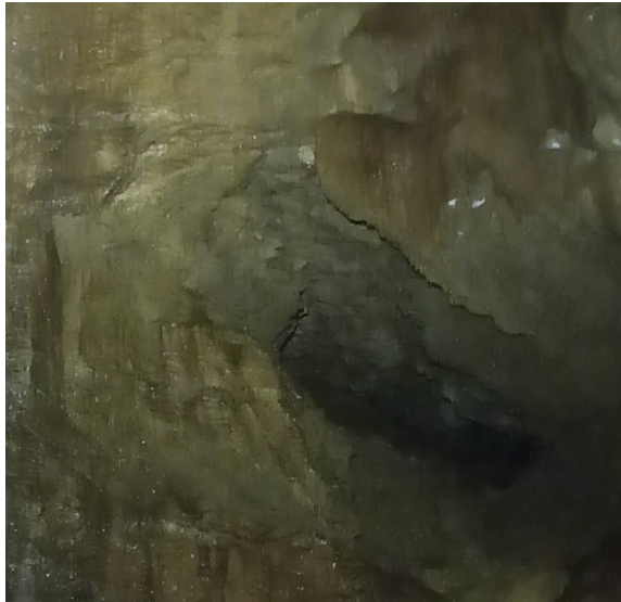
Photo 1 : Lucarne à environs 4m de la base de l'escalade des « Éponges » : ça queue !

15h, assuré par Solveig. Cette grimpe est plaisante, la roche est saine et la ligne que j'emprunte est relativement hors crue pour que je ne sois finalement pas trop perturbé par l'arrivée d'eau ; Solveig plus bas n'a pas la même chance et se prend quelque embruns . Cinq mètres plus haut j'arrive à hauteur d'un lucarne sur ma droite... de la potentiel première facile à atteindre. Mais je préfère la laisser pour tout à l'heure, il sera toujours temps d'y penduler au retour, un peu de patience !