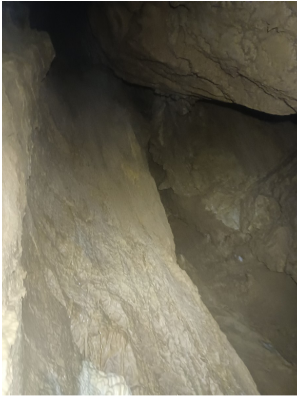
Photo5 : d'autres suites ?