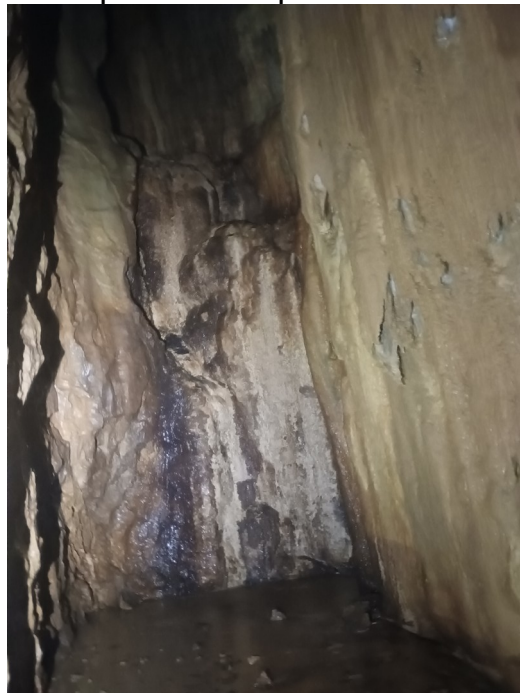
Photo3 :La plateforme (terminus du jour)

La suite est donc une nouvelle escalade d'une vingtaine de mètres menant à ce qui ressemble à un beau départ horizontal. Mais le plus beau c'est de là où nous sommes arrêté, il y a en fait plusieurs départs !