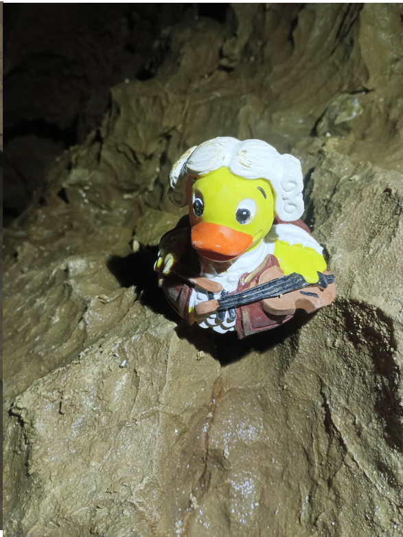
Photo6 : Mozart Duck est déjà sur place ;)