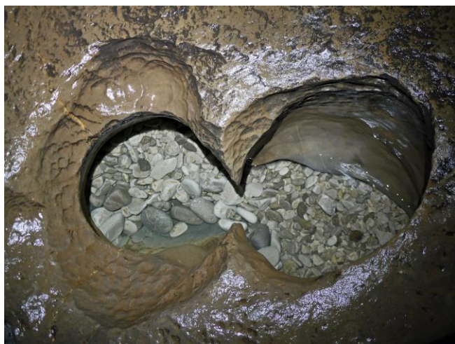
Qui a perdu ses lunettes ?