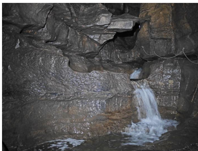
et du bas (la demi cascade supérieure).