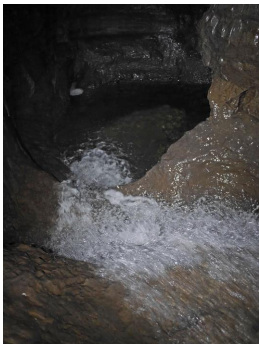
Cascade Bocquet, vue du haut...