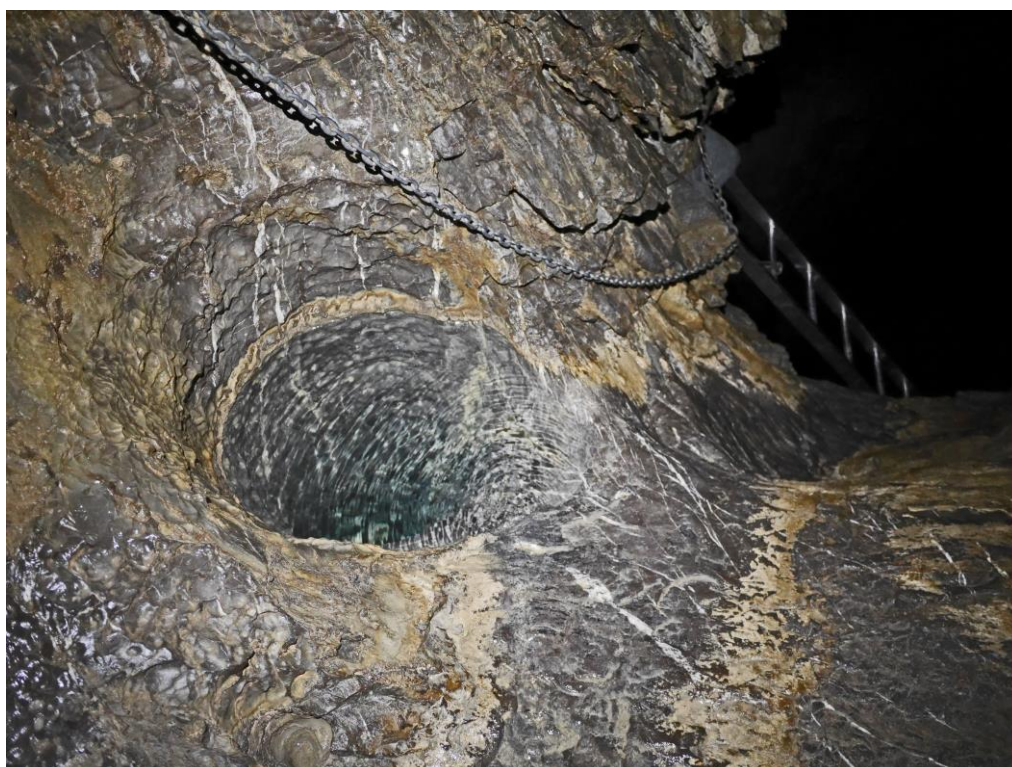
La marmite en haut du ressaut du Lac des Perroquets.