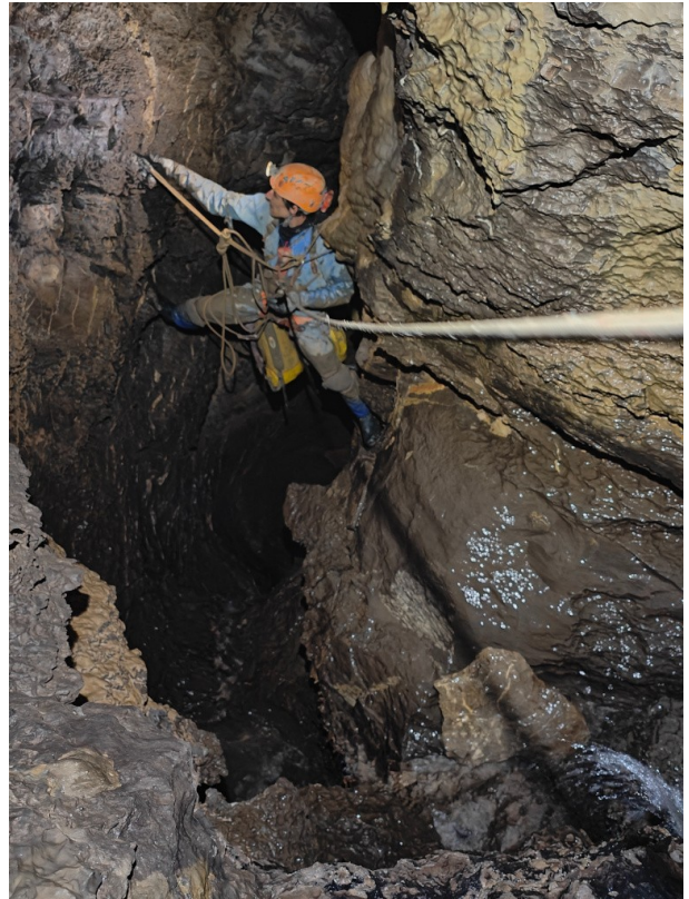
Équipement au dessus de la rivière

commence par le puits vu la dernière fois et non descendu, qu'on appellera le puits de l'œuf à cause d'un galet ovoïde trouvé à son pied. Il est vertical, large et rejoint l'actif perdu au début de la galerie fossile. On ne visitera pas cet amont car c'est trop aquatique. Un petit affluent ruisselle sur la paroi en face. Ensuite commence un méandre jamais très étroit (on est souvent de face), presque horizontal et parcouru en son fond par la rivière. Je pars en avant à la recherche du premier obstacle à équiper et qui ne vient pas car le méandre continue, continue, continue, égayé de-ci de-là par quelques fistuleuses et excentriques ainsi que deux énormes coulées blanches. C'est finalement une vasque qui demande un équipement en main courante puis la pente s'accroît avec de petits ressauts où je pose des bouts de corde.