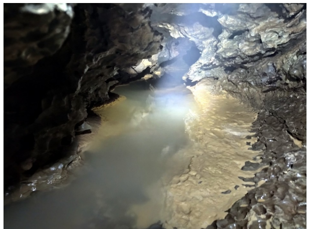
Le terminus du jour dans l'actif