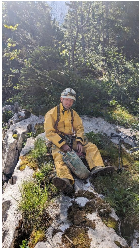
Les kits sont sortis depuis les puits montants à -230m.