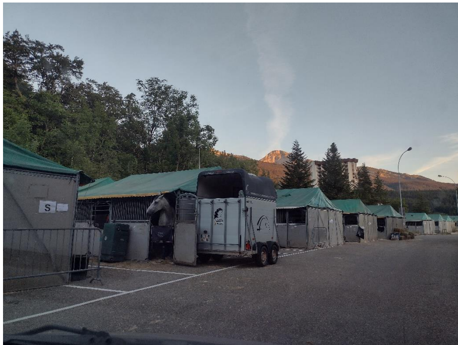
Les jolis chevaux.