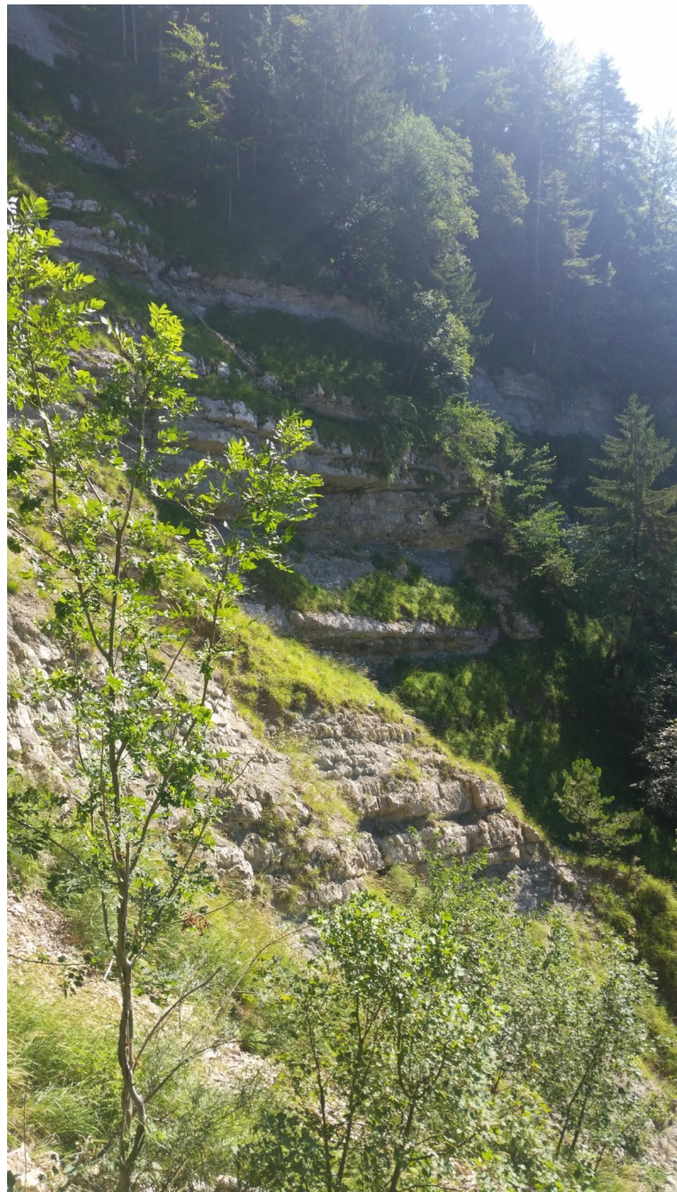
Les rochers au dessus de la source de l'affluent

De ce point un chemin redescend en direction du ruisseau de l'Échalance. Sa résurgence se situe sous un bloc de 2m 3 juste au dessus du chemin. Mais en période plus humide il se manifeste probablement plus haut, d'ailleurs le sol de la forêt (terre) juste au dessus est creusé de goulottes.