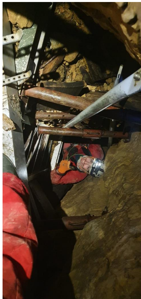
Entrée et trémie peu rassurante