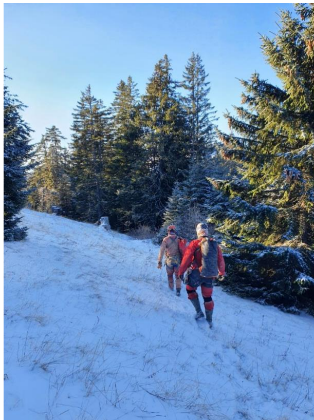
Marche d'approche dans la neige et le froid