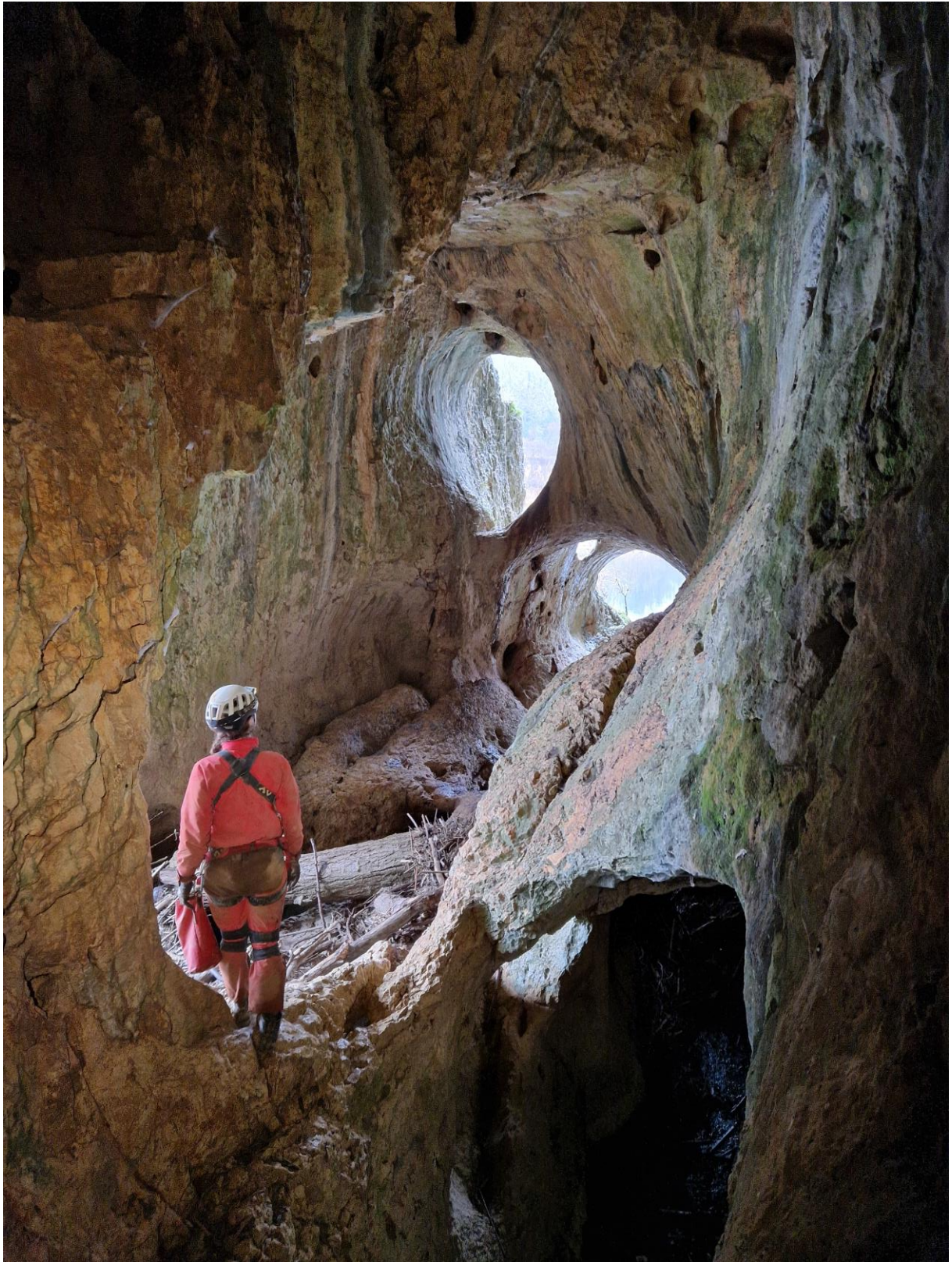
Zone de sortie de la grotte aux fées