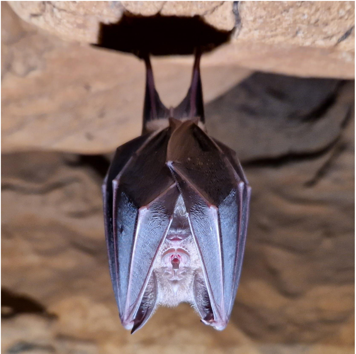
Grand Rhinolophe