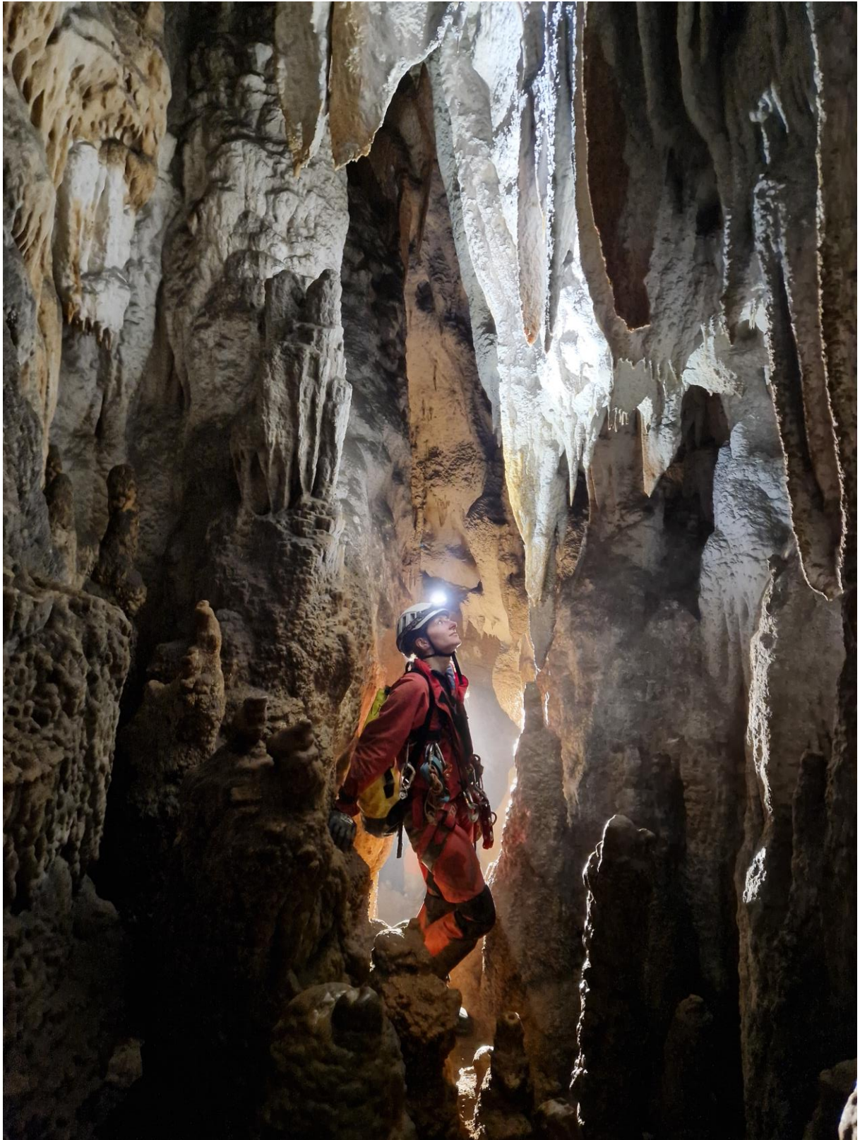
Zone concrétionnée peu après l'entrée