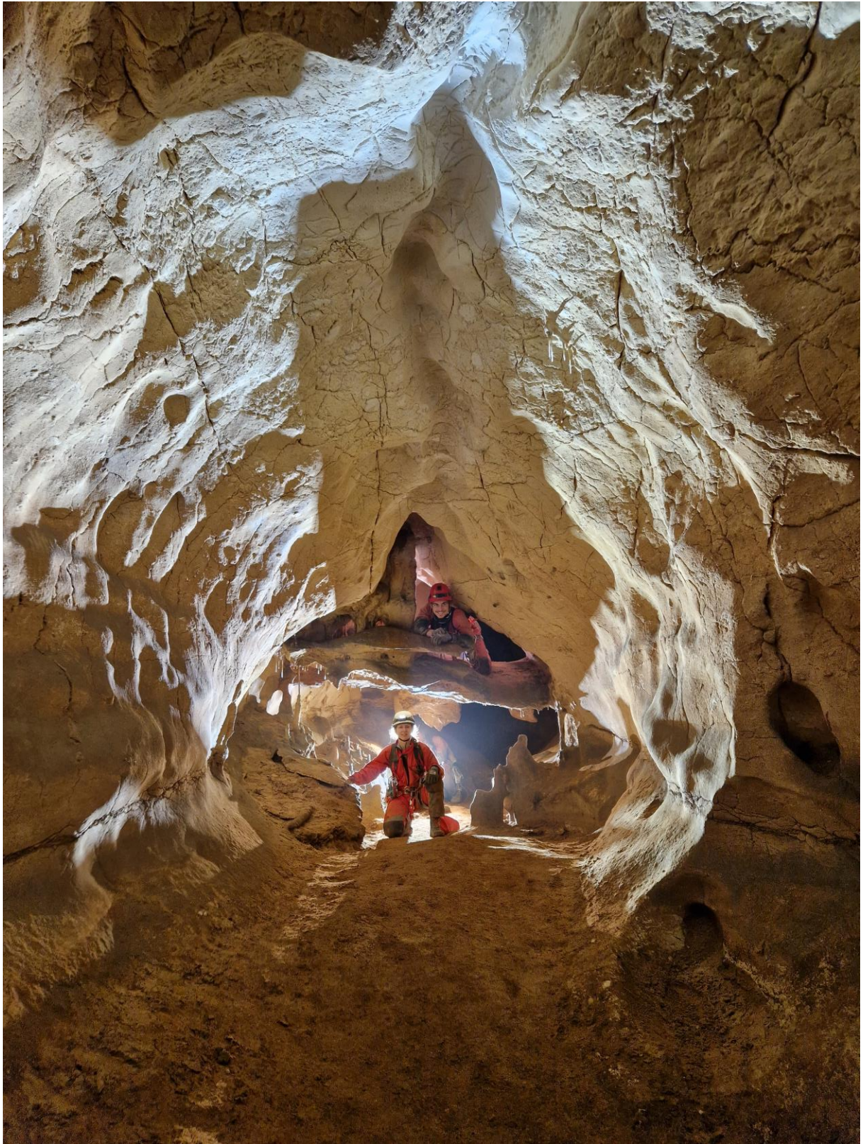
Galerie avec chenal de route