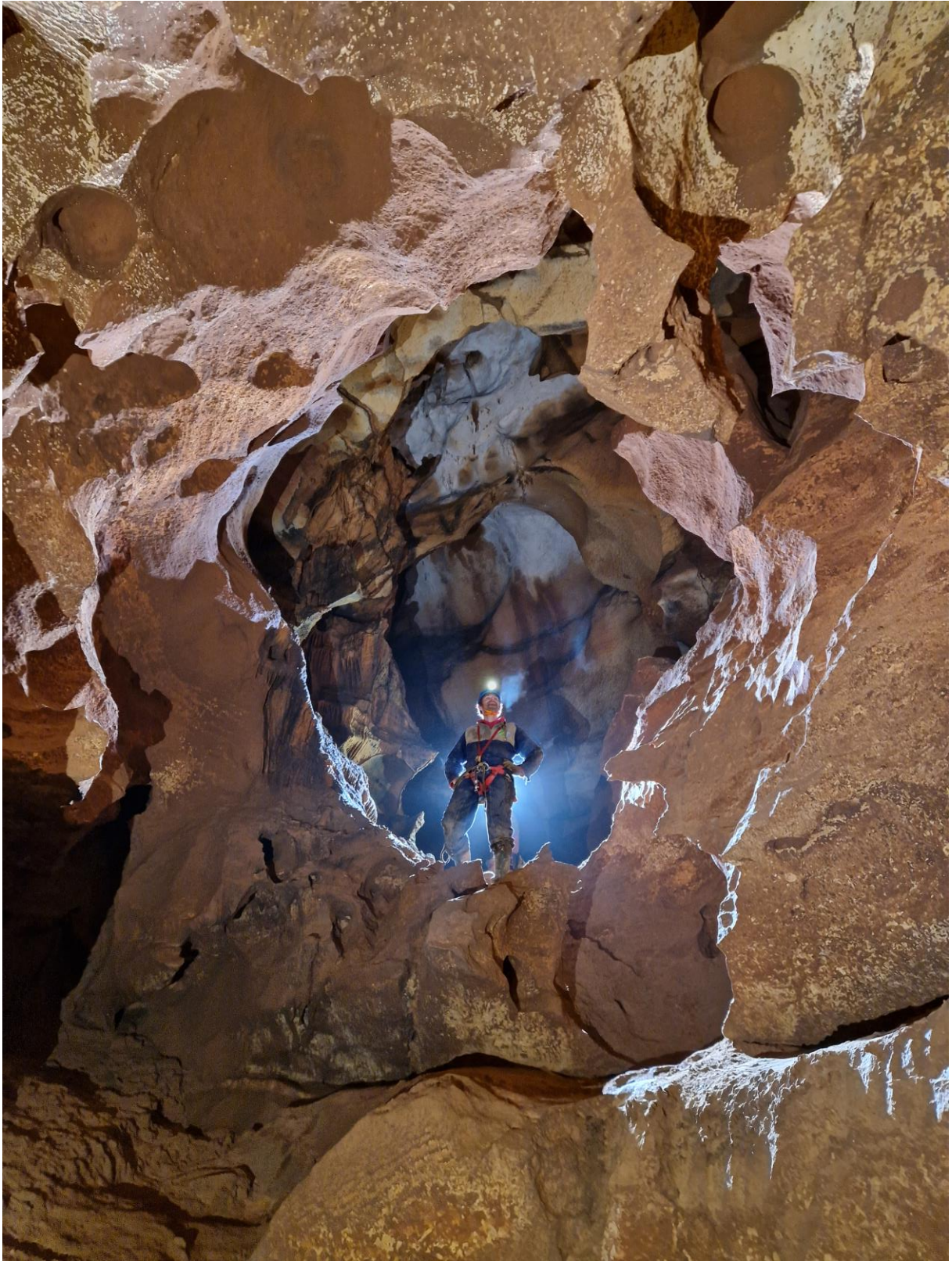
Dans les grandes galeries sculptées