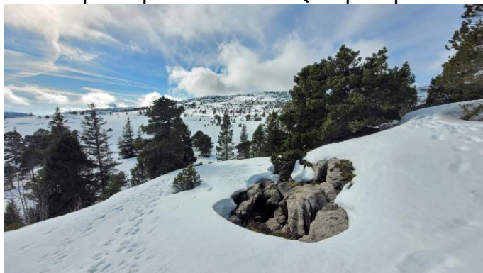
le Petit Trou, bien dégagé.

Il fait trop beau pour aller sous terre (d'ailleurs j'ai horreur du noir...) aussi je dirige mes pas vers le plateau du Parmelan. Vu l'enneigement je peux monter par la piste à 1350 m et emprunte le sentier passant par les Chappeys. A l'arrivée au croisement du passage Grand Montoir-Petit Montoir je mets les « cramponnettes » car la neige est très dure. Je les garderai jusqu'au retour, les raquettes resteront sur le sac, la neige porte bien. Montée donc par le Petit Montoir, puis directement par la combe qui traverse en direction du gouffre du Ramoneur et ensuite le sentier des lapiaz. Je voulais ausculter un trou à la recherche de courant d'air mais j'ai la surprise de le trouver complètement bouché ! Donc je continue et fais un grand tour dans le secteur du mamelon où s'ouvre le Petit Trou qui, comme d'habitude, souffle fortement. Le thermomètre laser me donne une température de 7°C, même si la précision est relative c'est étonnamment chaud ! D'autres trous souffleurs donnent des températures plus cohérentes variant de 3,5° à 5,3°. Tout est en conditions aérologiques estivales (la neige fond au soleil), sauf (au retour) le secteur du gouffre de l'Oubli où les cavités aspirent (températures négatives dans les entrées). Bref, ces observations ne manquent pas d'intérêt. Quelques photos de cette agréable balade :