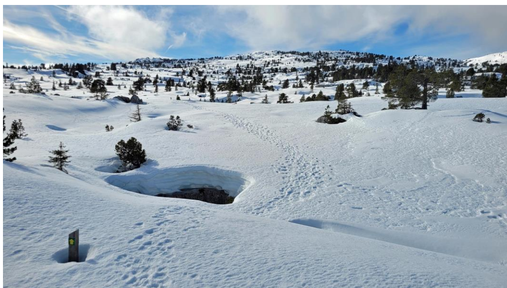
le plateau enneigé, la couche ne dépasse guère un mètre.