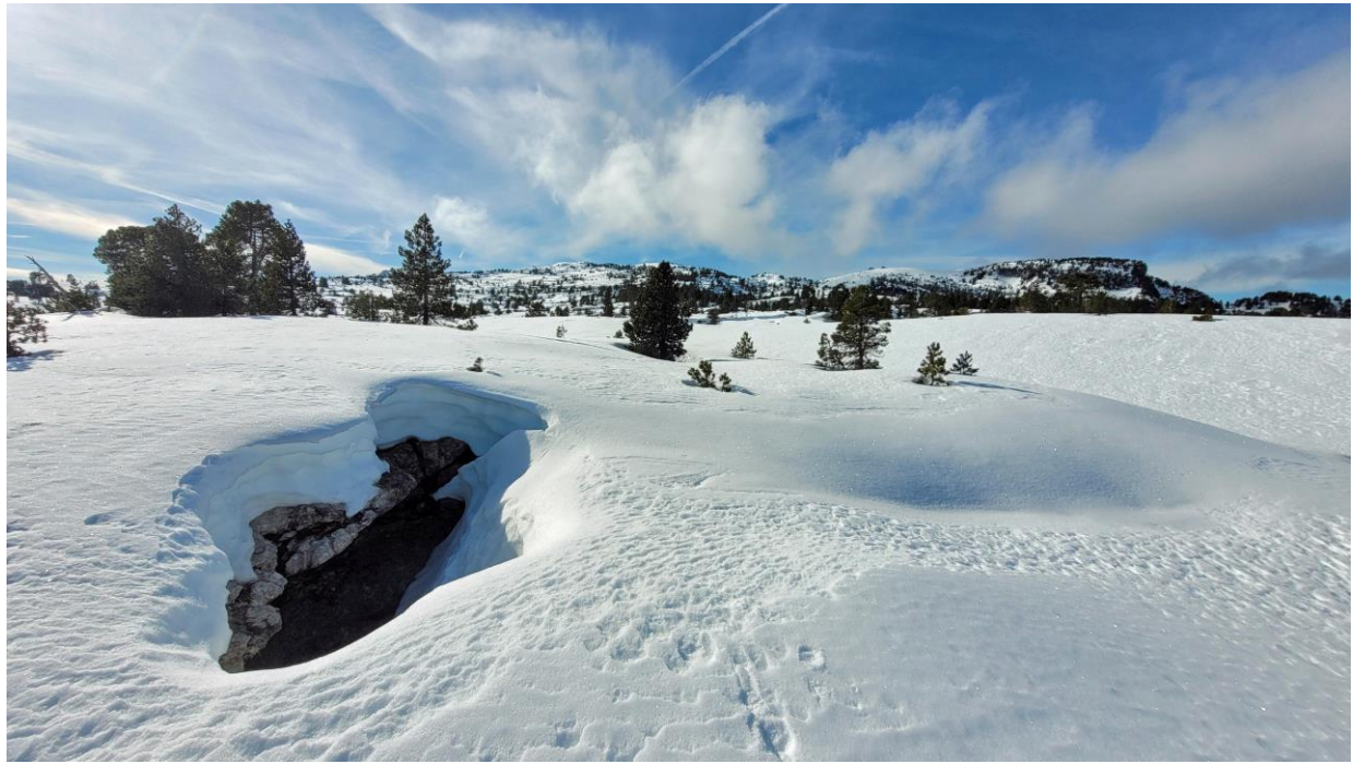
l'entrée en méandre de la Tanne des Optimistes, point de départ de l'Affluent des Grenoblois, réseau de la Diau.