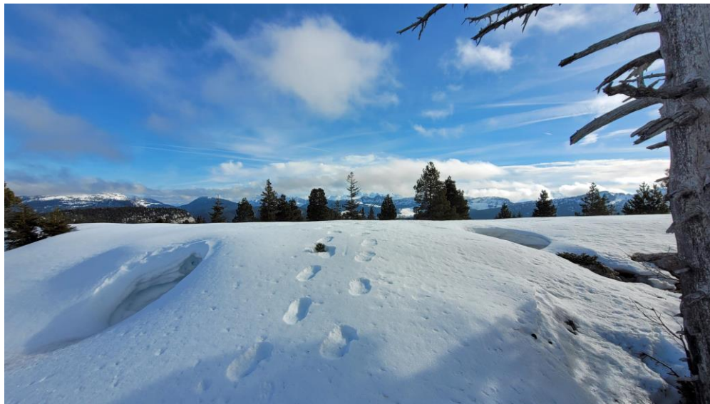
on a marché sur la neige, entre deux trous souffleurs...