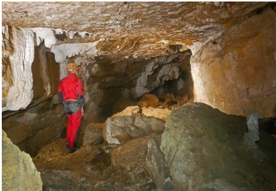
La galerie en bas du ressaut d'entrée.