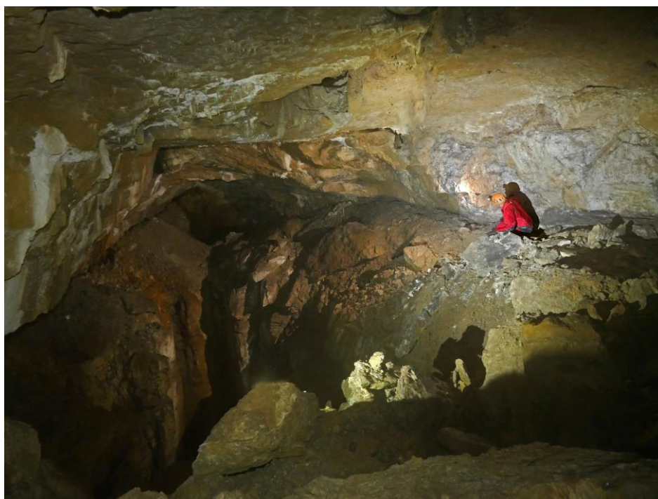
La galerie et sur la gauche l'ouverture béante du puits de 80 m.