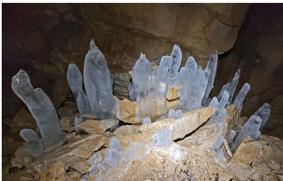
Dans la salle en bas de la fissure d'entrée.

Nous repartons donc vers le Petit Trou, en suivant le sentier des lapiaz. Là il souffle un vent bien rafraichissant et c'est un plaisir de se laisser glisser dans le ressaut d'entrée pour rejoindre la belle galerie, où je vais déposer un thermomètre enregistreur, tout en relevant la température ponctuelle avec mon autre capteur (5°C, mais peu significatif car, pour une fois (le vent du Sud doit y être pour quelque chose) le courant d'air aspire nettement). Didier en profite pour faire quelques jolies photos, puis nous achevons notre mission en surface avant de revenir en passant, cette fois, par l'Anglettaz. Une sortie à l'ambiance presque hivernale !