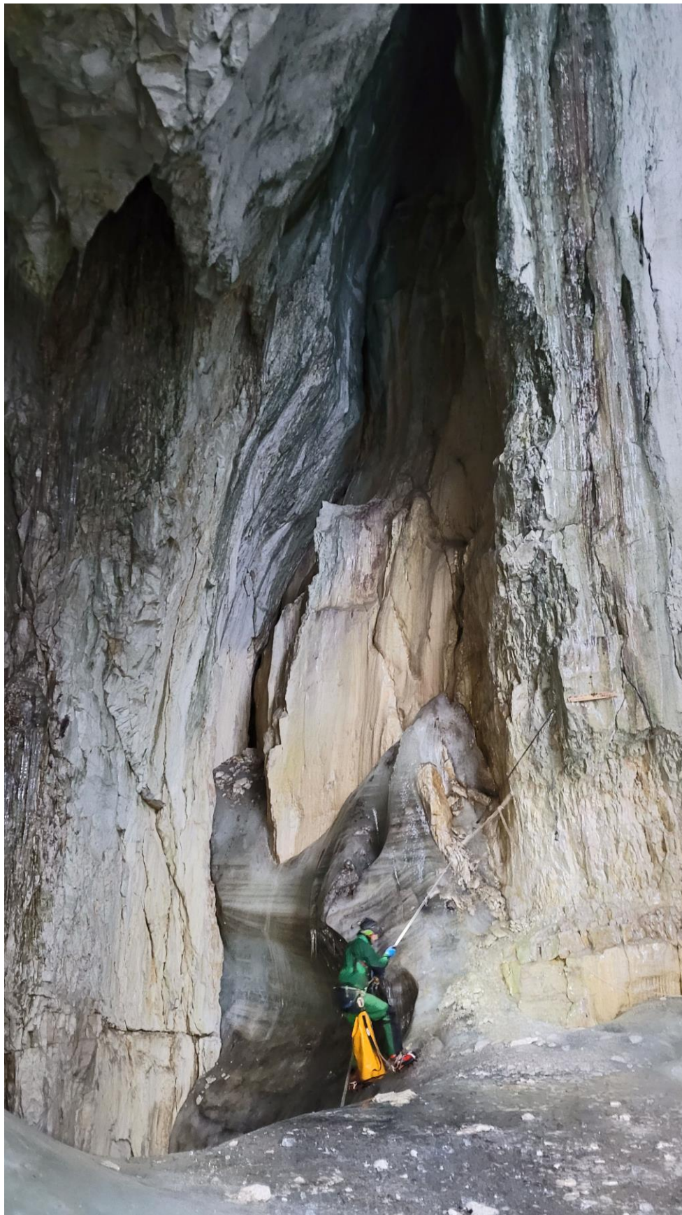
Le trou dans la glace, direction le fond.