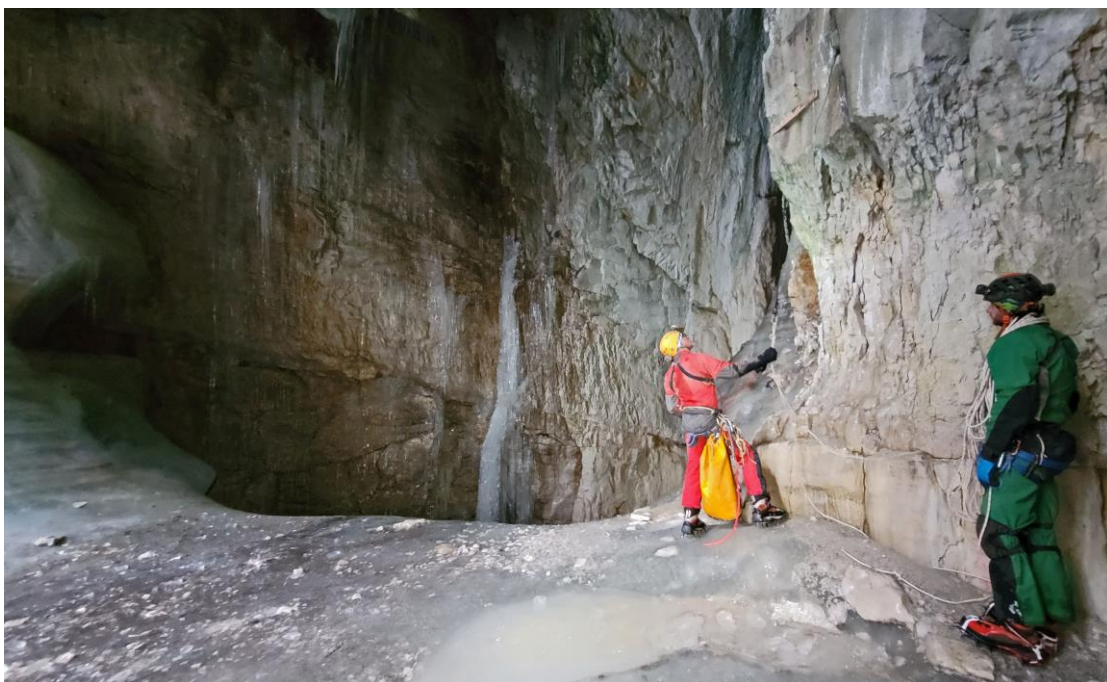
Equipement du P12.