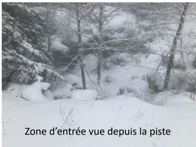
Zone d'entrée vue depuis la piste

Attention car le « toboggan » débouche en direct sur le puits ;-).