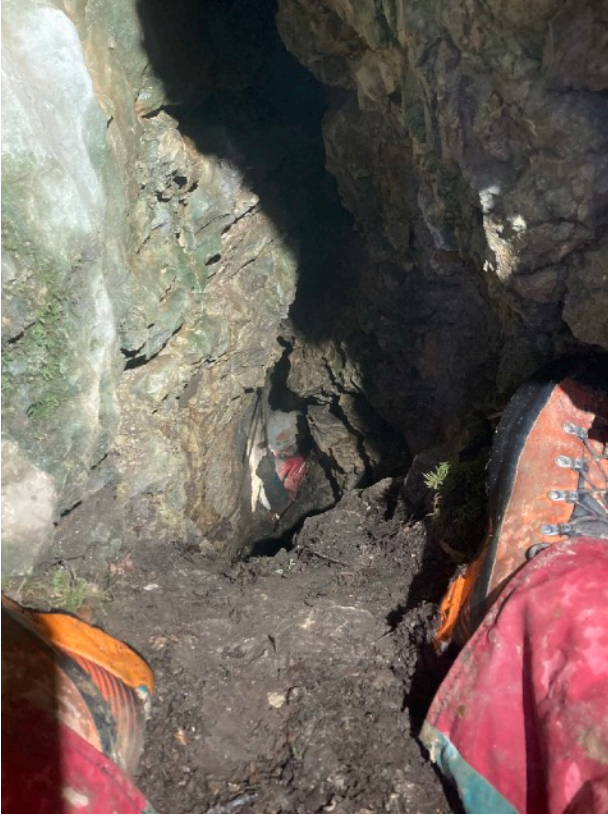
Jean en haut du P4 vu depuis l'entrée....