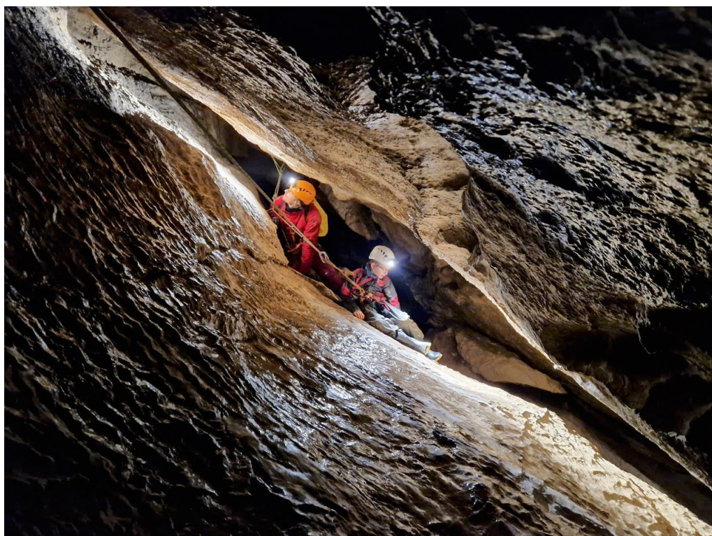
En haut du toboggan des Oreillards