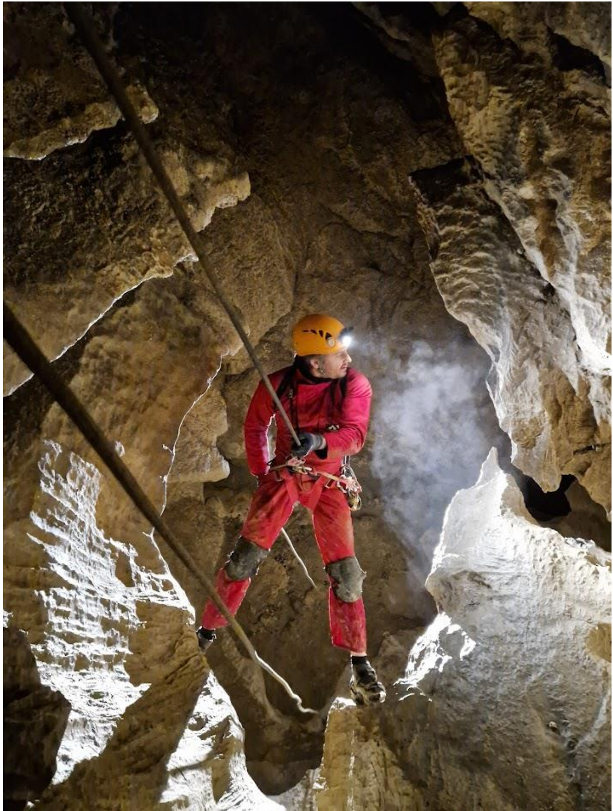
L'unique verticale du parcours