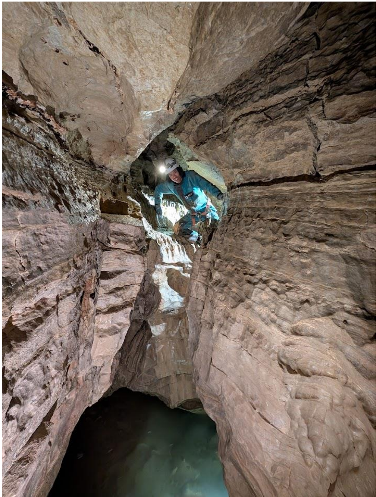
Thomas au débouché de la boucle (bas du R5), le boyau rond, non visible sur la photo est juste sur la gauche