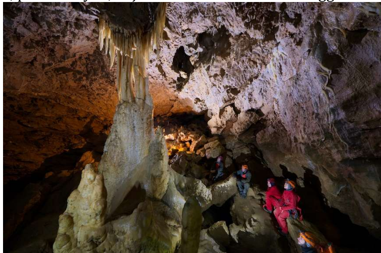
La colonne en 2019

On découvre ensuite la grande salle où se forment de nombreuses concrétions. Au bout, je grimpe l'escalier menant à la colonne. Je l'équipe puis j'apprends à tout le monde l'utilisation de la poignée, qu'ici on chausse d'un mousqueton. On attend tout le monde en méditant sur le temps de formation de cette colonne, sans doute de l'ordre de 100000 ans. On monte l'échelle, puis le boyau, et j'arrive au sommet du toboggan.