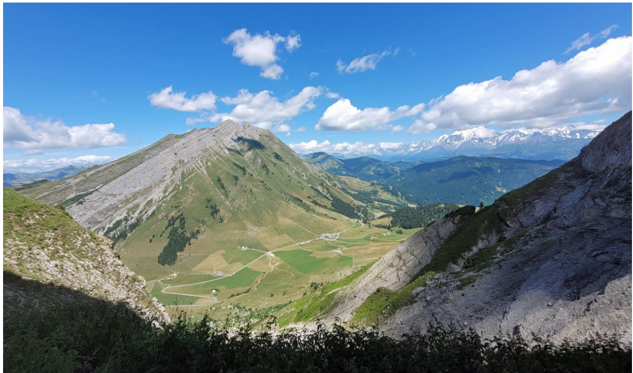
Vue imprenable sur le col des Aravis, Bordonan à gauche, Mont Blanc à droite !