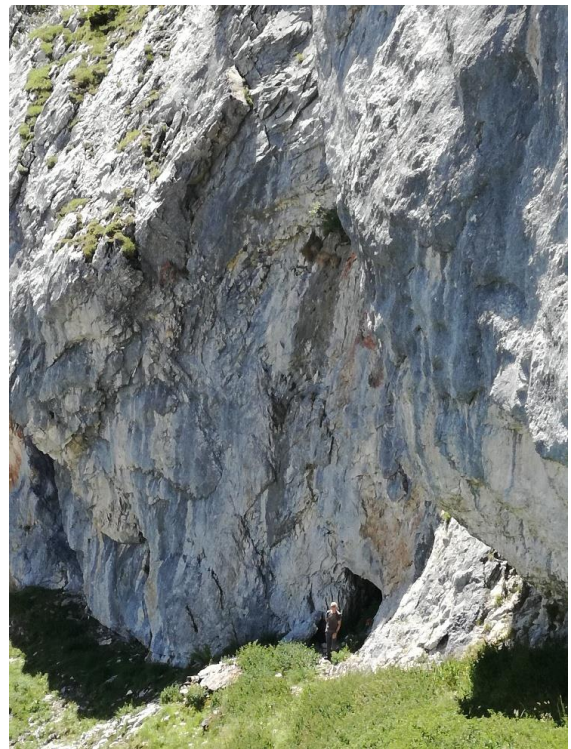
L'entrée au pied de la falaise.