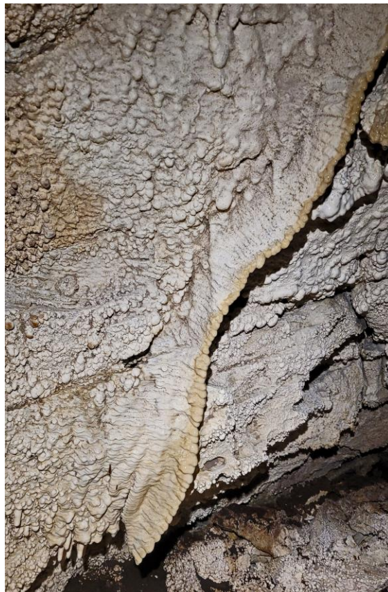
Il y a même des concrétions !