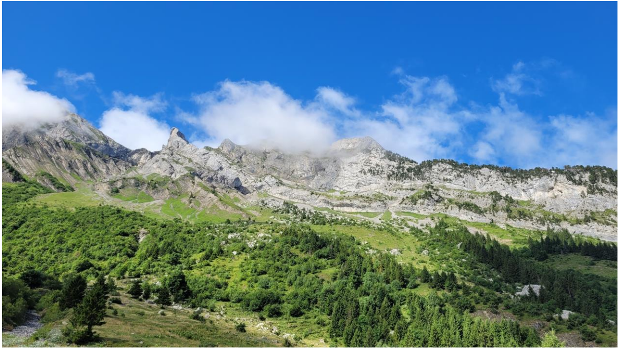
La face Est de Merdassier. Le trou est quasiment au milieu de la photo...