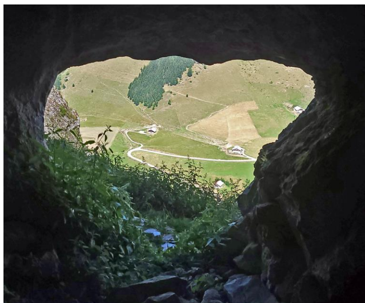
Le porche vu de l'intérieur.