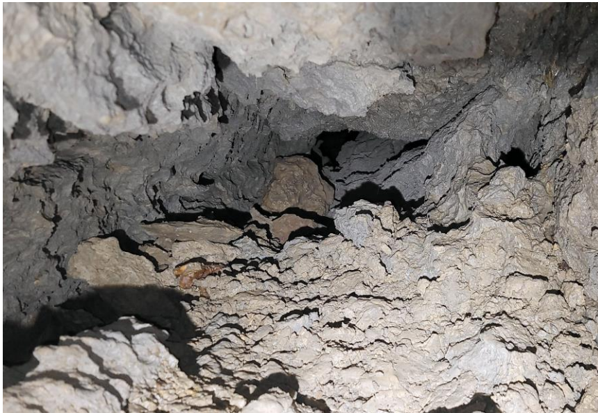
La suite serait là... Vue plongeante à 45°.