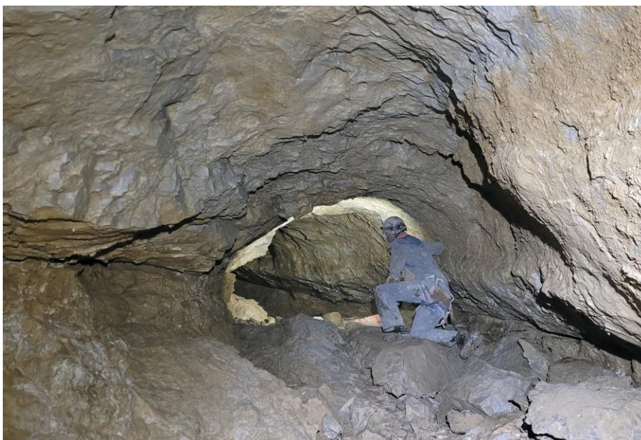
La conduite forcée.