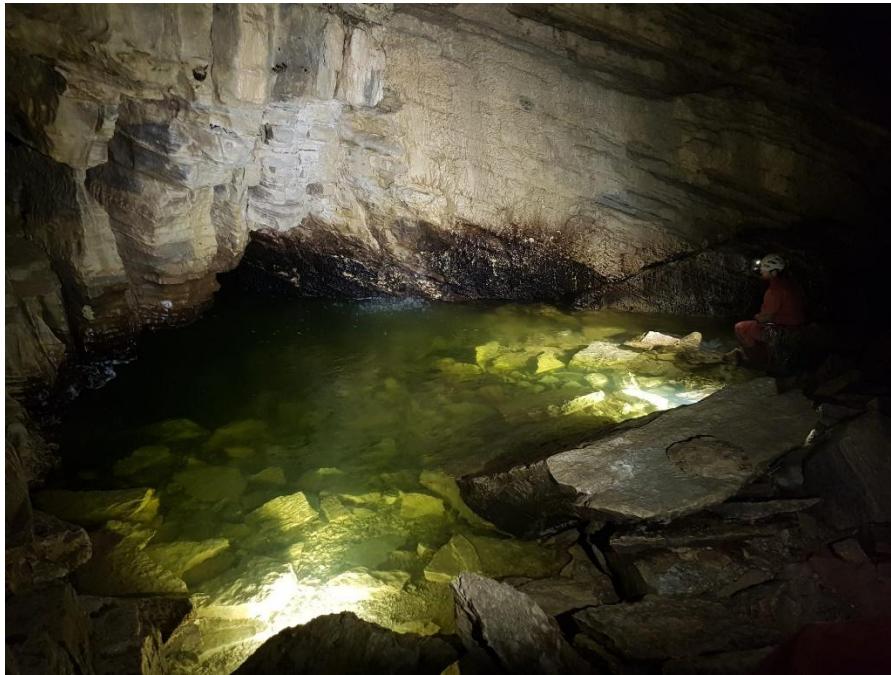
Le lac de la salle à manger