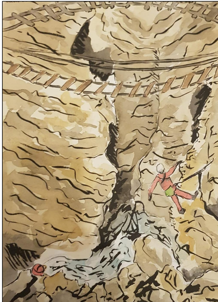
Le canyon ... depuis la salle à manger