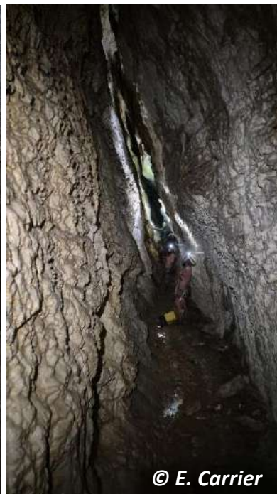
Rappels et galeries de la première partie de la boucle Guiers-Guiers