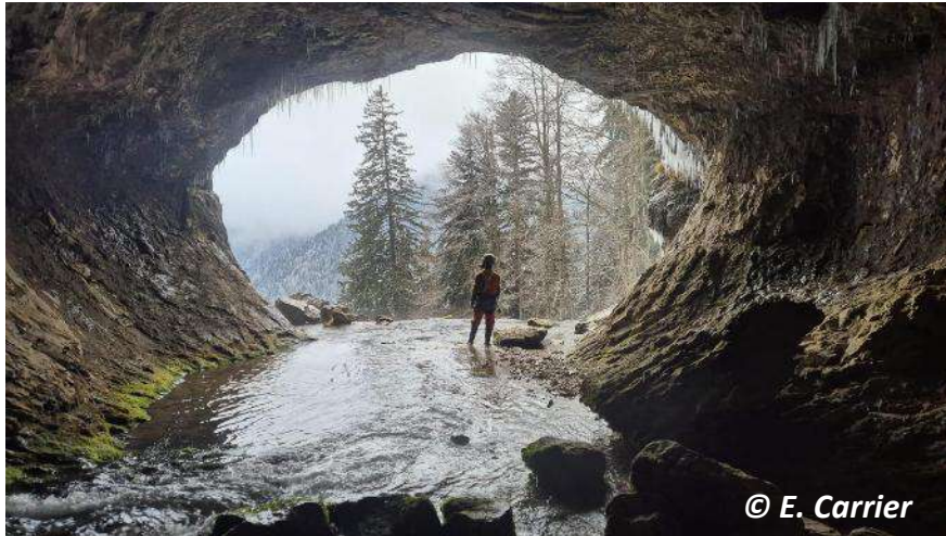
Grande salle du Guiers Mort (porche)

Arrivés au grandiose porche ( grande salle du Guiers-Mort ), attention à la glace vive qui recouvrait presque tout, ajoutant un piquant non négligeable à nos premiers pas dans la cavité. Après s'être équipés et avoir communiqué nos plans à Pierre, notre sonnette attentive, nous étions prêts à nous engager dans le réseau souterrain. Il est environ 10h !