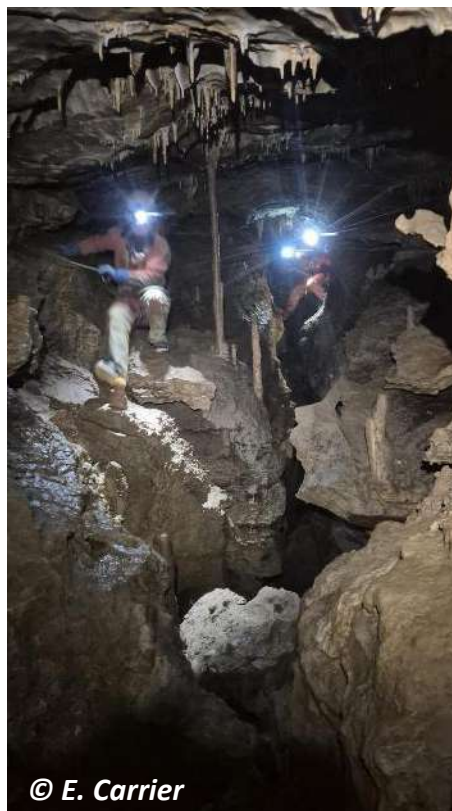
Entre secteur du Collecteur (gauche) et la vire des stalactites (droite)