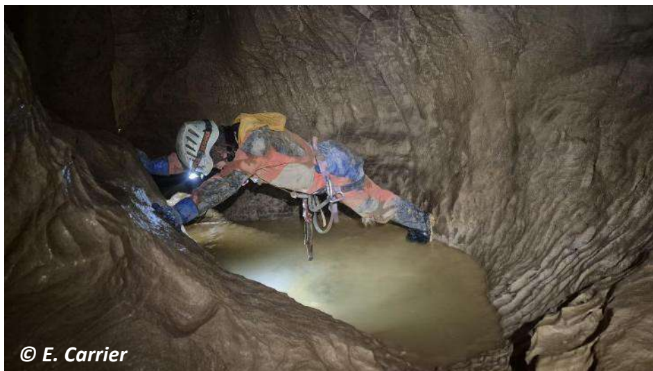
Gainage dans le secteur du Collecteur

Attention à noter : la corde de la main courante dans la Galerie du Faciès Souriant est abîmée.