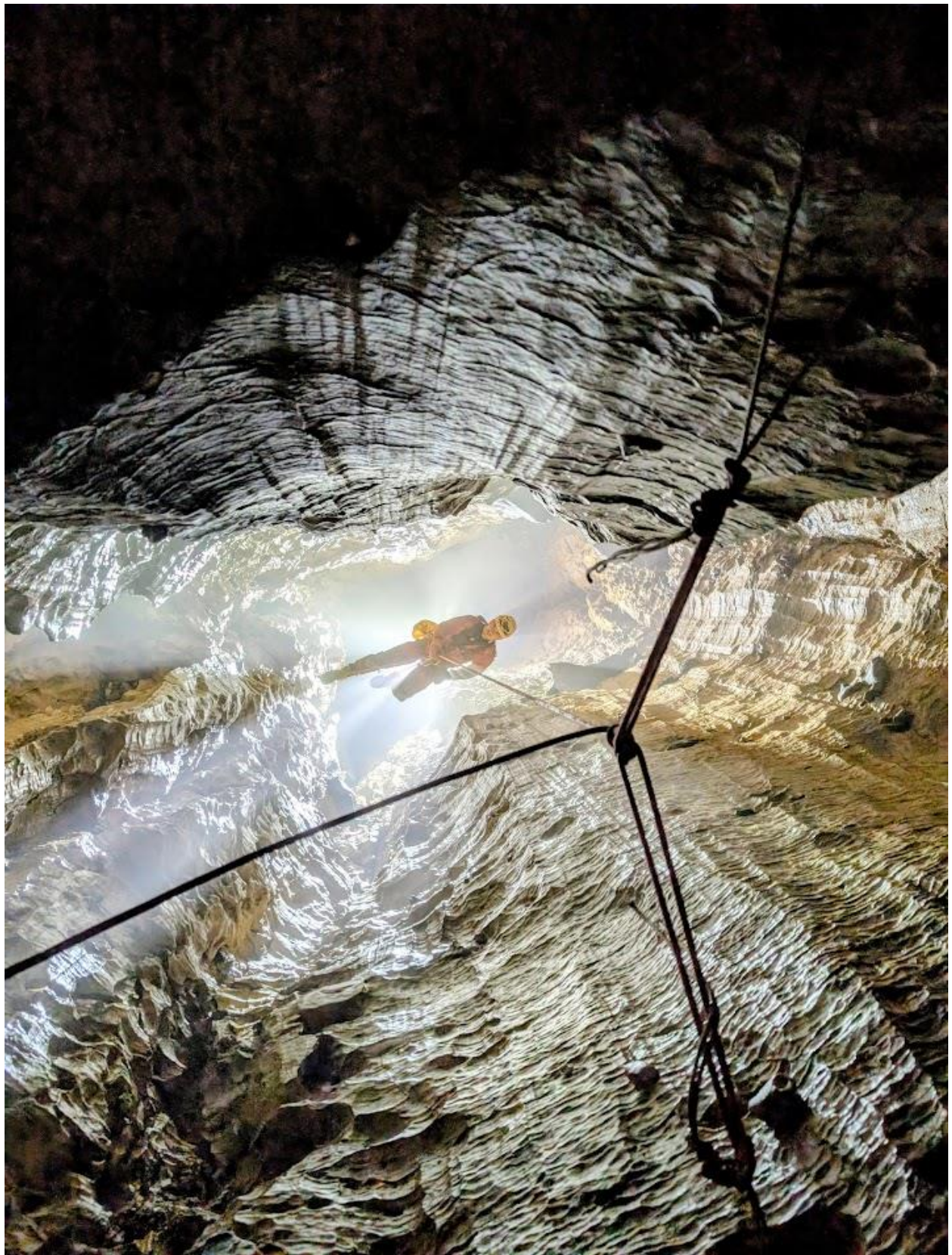
Partie basse du beau P31