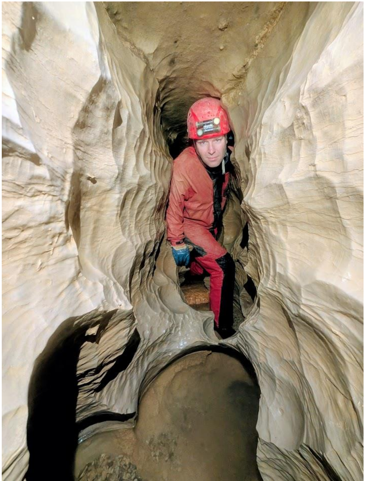
Le méandre, Quelques dizaines de mètres avant le P13