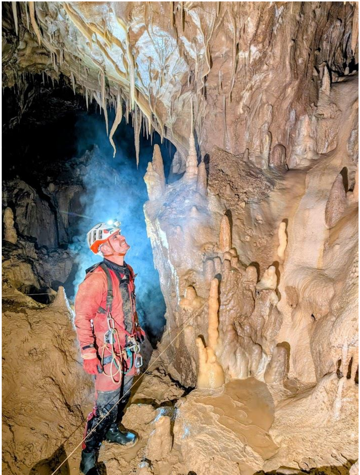
Salle Sophie