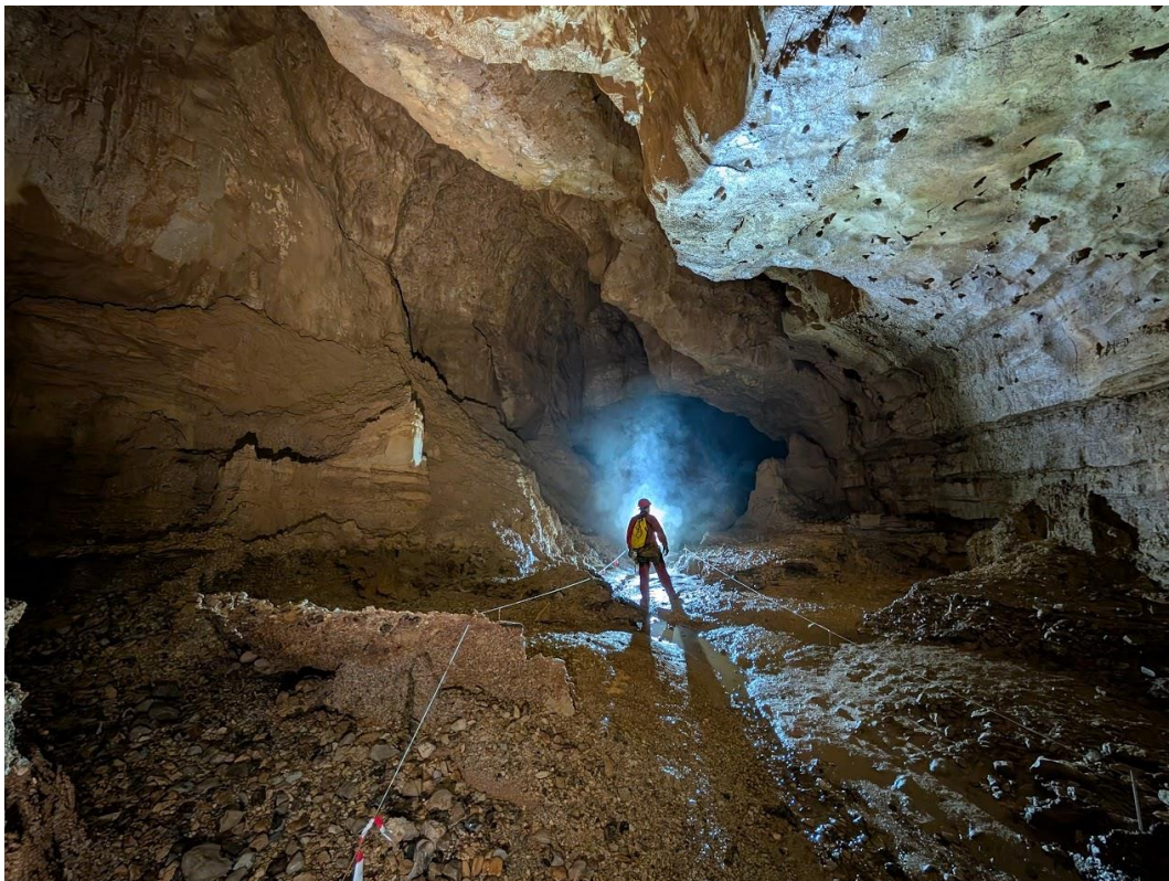
Galerie des Vertacomicroiens